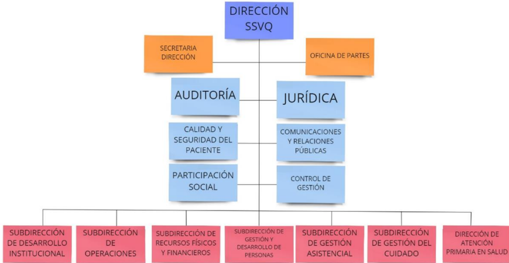
Ilustración 1: Organigrama